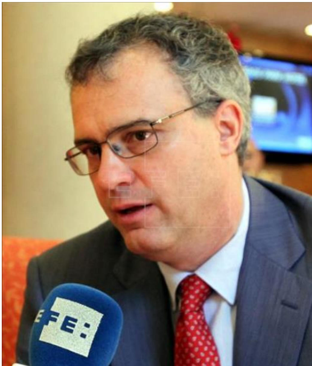
El subdirector general de la FAO Eduardo Rojas.

"Estabilizar la situación en países que están pasando momentos difíciles tiene mucho que ver con cómo se trata el medio rural. Los procesos de migración del campo a la ciudad son muy intensos en estos países", afirma el responsable español, que pone de ejemplo Argelia, donde ese movimiento ha sido "casi completo".